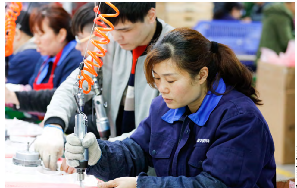
Das Lieferkettensorgfaltspflichtengesetz soll auch die Bedingungen in den Fabriken Ostchinas verbessern.

Beim LkSG geht es um ein umfassendes Paket von Sorgfaltspflichten, die im Unternehmen umgesetzt werden sollen, um eine CSR ( Corporate Social Responsibility ) sicherzustellen; hier sind Menschenrechte aufgelistet, die v.a. im Kontext mit Arbeit eine Rolle spielen (Verbot von Kinder- und Zwangsarbeit sowie von Enteignungen, Arbeitsschutzbestimmungen, Koalitions-