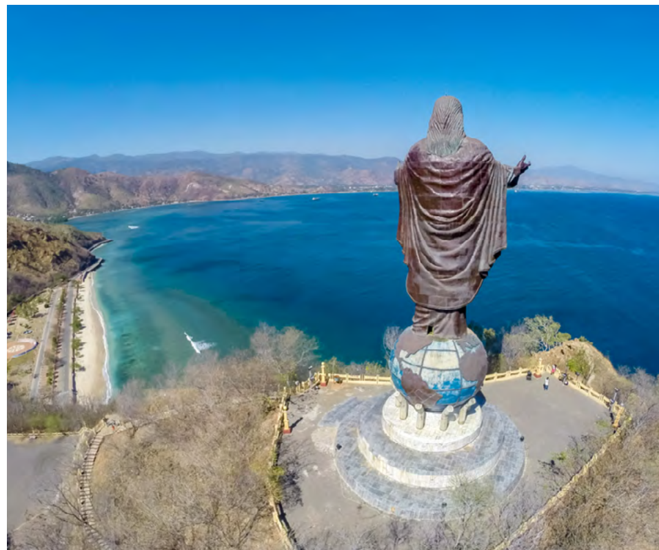
So wie sich die Christi-Statue nahe der Hauptstadt Dili der Welt zuwendet, will sich auch das Land stärker öffnen.

So werden die positiven Effekte der hohen Preise durch den Produktionsrückgang im Öl- und Gassektor teilweise aufgehoben. Dies führt zu Exporteinbußen gegenüber dem Vorjahr. Aufgrund der hohen Rohstoffpreise sowie infolge des Inflationpuffers verschärft sich außerdem der