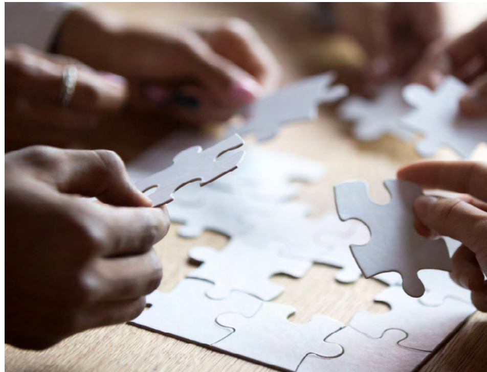
Beim Club-Deal koordinieren meist ein oder zwei Banken die Zusammenstellung des Konsortiums.

Der Club-Deal zeichnet sich Rapp zufolge dadurch aus, dass er stark beziehungsgetrieben ist. Das hat auch Einfluss auf die Konditionen des Konsortialkredits, denn dieser wird beim Club-Deal nicht isoliert betrachtet. Zwar orientiert sich die Kreditmarge in erster Linie am Risikoprofil des Kunden und jeder Kredit müsse für sich genommen auch profitabel sein. Doch weil der Kredit von den Hausbanken bereitgestellt werde, spiele auch das sogenannte Cross-Sell-Potenzial eine wichtige Rolle – also welches lukrative