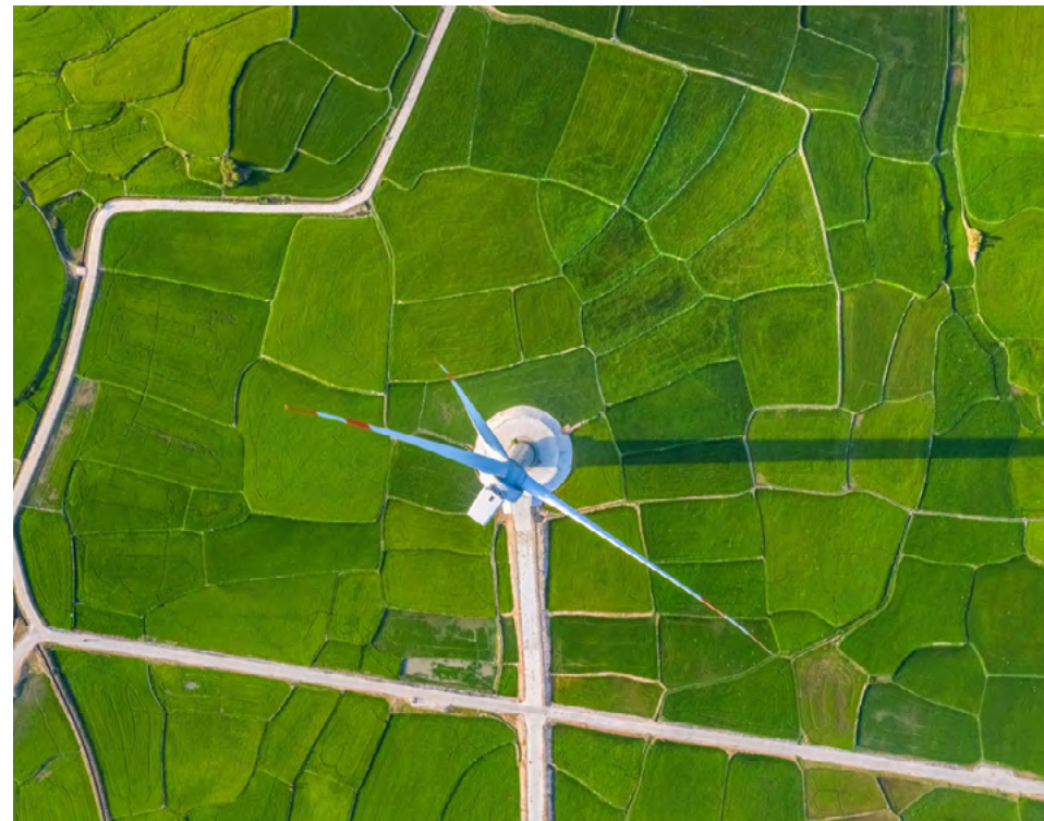
Reisfelder gehören schon lange zum Landschaftsbild, bei Windrädern ist Vietnam u.a. aufs Ausland angewiesen.

Das BIP-Wachstum lag während der beiden Corona-Jahre 2020 und 2021 jeweils zwischen 2 und 3%. Das war zwar deutlich weniger als zuvor, aber im ersten Jahr der Pandemie mussten die meisten Volkswirtschaften ein kräftiges Minus beim Wachstum hinnehmen. In den kommenden Jahren sollen die BIP-Wachstumsraten Vietnams laut Experten zwischen 6 und 7% jährlich und damit wieder annähernd das Niveau der Vorkrisenzeit erreichen. Mit diesen Werten würde Vietnam zu den Spitzenreitern in Südostasien gehören.