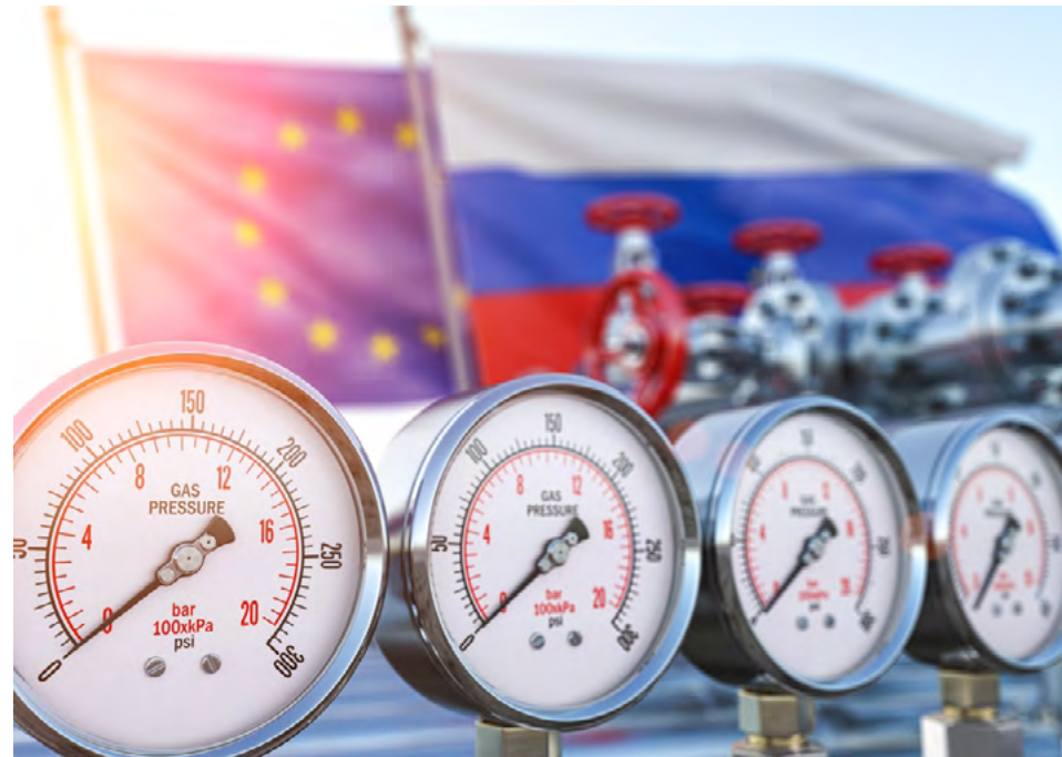
Auch das siebte Sanktionspaket der Europäischen Union gegen Russland beinhaltet kein Gasembargo.

Als Reaktion auf die Anerkennung der Staatlichkeit der beiden „Volksrepubliken“ Donezk und Luhansk durch Russland am 21. Februar 2022 und den Überfall Russlands auf die gesamte Ukraine am 24. Februar 2022 hat die Europäische Union bisher insgesamt sieben Sanktionspakete gegen Russland verhängt. Dadurch wurden die als Reaktion auf die völkerrechtswidrige Annexion der Krim durch Russland am 18. März 2014 verhängten EU-Russland-Sanktionen schrittweise ausgeweitet und verschärft. Die Implementierung der Sanktionspakete erfolgt hierbei durch Änderungen der bestehenden EU-Sanktionsverordnungen