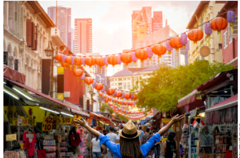
Die Krisen dieser Welt bekommt auch Singapur zu spüren, aber der Stadtstaat ist gut aufgestellt.

2021 hatte Singapur mit knapp 70.000 USD eines der höchsten BIP pro Kopf weltweit. Mehr als zwei Drittel der Volkswirtschaft entfallen auf den Dienstleistungs- und Bankensektor, ein Drittel auf die Industrie. Singapur ist ein pulsierendes Finanzzentrum mit rund 120 Kreditinstituten, darunter auch die größten Banken Asiens wie die DBS Group, die Overseas Chinese Banking und die United Overseas Bank. Man verfolgt einen sehr offenen und globalen Ansatz, der im sog. Singapore Financial Data Exchange manifes-